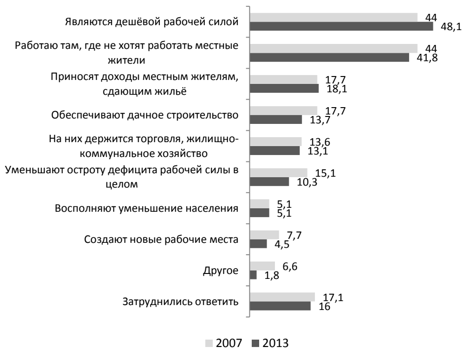
Рис. 1. Положительные последствия миграции, %

опрошенных в 2007 и 2013 гг. 1 , которые показывают, что за последние годы основные тенденции в отношении к миграции со стороны населения не претерпели значительных изменений.