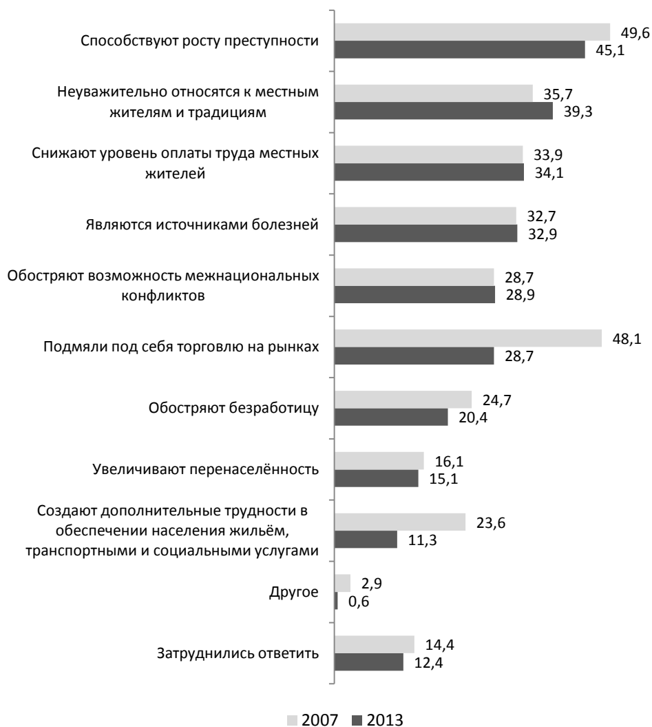
Рис. 2. Отрицательные последствия миграции, %

Как положительный момент, согласно официальной статистике, также следует отметить возмещение трудовыми мигрантами потери населения трудоспособного возраста в условиях, когда в Российской Федерации ежегодно фиксируется уменьшение количества экономически активного населения.