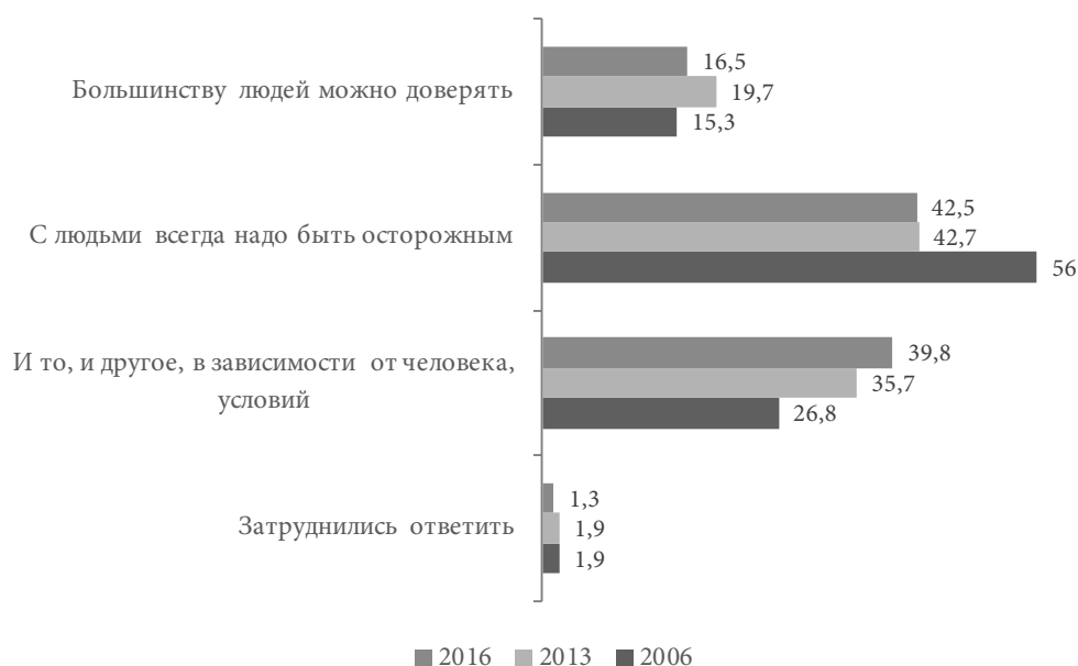
Рис. 3. Динамика уровня доверия к другим людям, 2006–2016 гг., %

и других важных обстоятельств, увеличилась с 26,8 до 39,8%. Это увеличение является одним из проявлений усиления рационального начала во взаимоотношениях между людьми, которое предполагает трезвый расчёт, обоснованность, продуманность поведения с опорой на накопленный опыт. Постепенный рост уровня межличностного доверия, улучшение взаимоотношений с окружающими людьми повышает уровень удовлетворённости жизнью и укрепляет ощущение счастья. Доверчивые и счастливые люди более отзывчивы и дружелюбны. Они стараются жить в согласии с окружающей действительностью, находить общий язык с другими людьми, с родственниками и соседями, коллегами и обычными знакомыми.