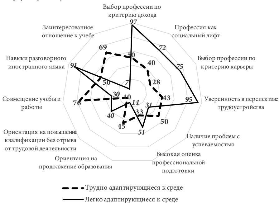
Рис. 2. Показатели жизненных стратегий, по которым анализируемые совокупности респондентов отличаются существенным образом, 2014 г., (доля в % от количества респондентов в каждой группе)

Чтобы дать обобщённое представление о существенных различиях двух целевых групп по показателям жизненных стратегий, мы построили сводную диаграмму (см. рис. 2).