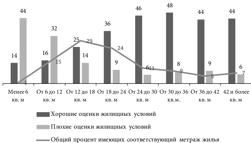
Рис. 3. Доля россиян с различным метражом жилья в расчёте на человека и оценка ими своих жилищных условий, 2018 г., %

ности метражом при этом – 12–18 кв. м на человека; именно такая жилищная ситуация характеризует 29% россиян (см. рис. 3). В то же время за последние три года даже в массовых слоях населения примерно каждому седьмому россиянину удалось улучшить свои жилищные условия, в том числе половина их (т. е. 8% всех россиян) сделали это за счёт покупки или строительства жилья. В итоге средний метраж, приходящийся на одного человека, даже в массовых слоях населения составляет сейчас в России почти 22 кв. м.