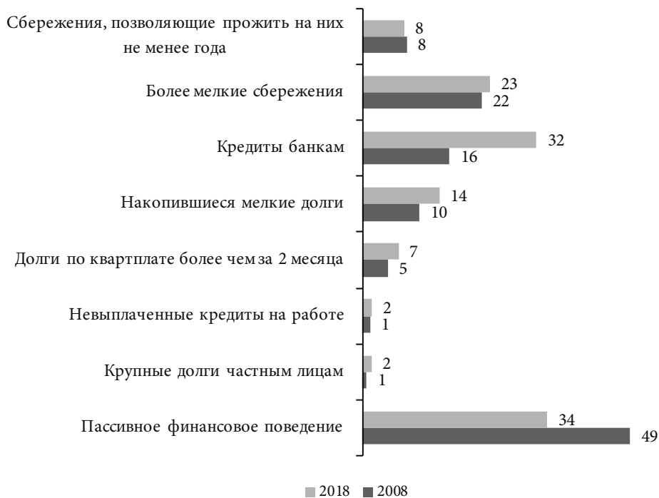
Рис. 6. Динамика численности россиян, имеющих сбережения и разного рода долги, 2003—2018 гг., %

Что же касается динамики в области кредитов и сбережений, то за последние 10 лет резко (с 49 до 34%) сократилось число сторонников пассивного финансового поведения, т. е. тех, кто не имеет ни сбережений, ни кредитно-долговой нагрузки. Одновременно в условиях стабильной численности имеющих как мелкие, так и крупные сбережения резко выросла численность имеющих кредитно-долговую нагрузку, и особенно — доля населения, выплачивающего кредиты банкам (см. рис. 6).