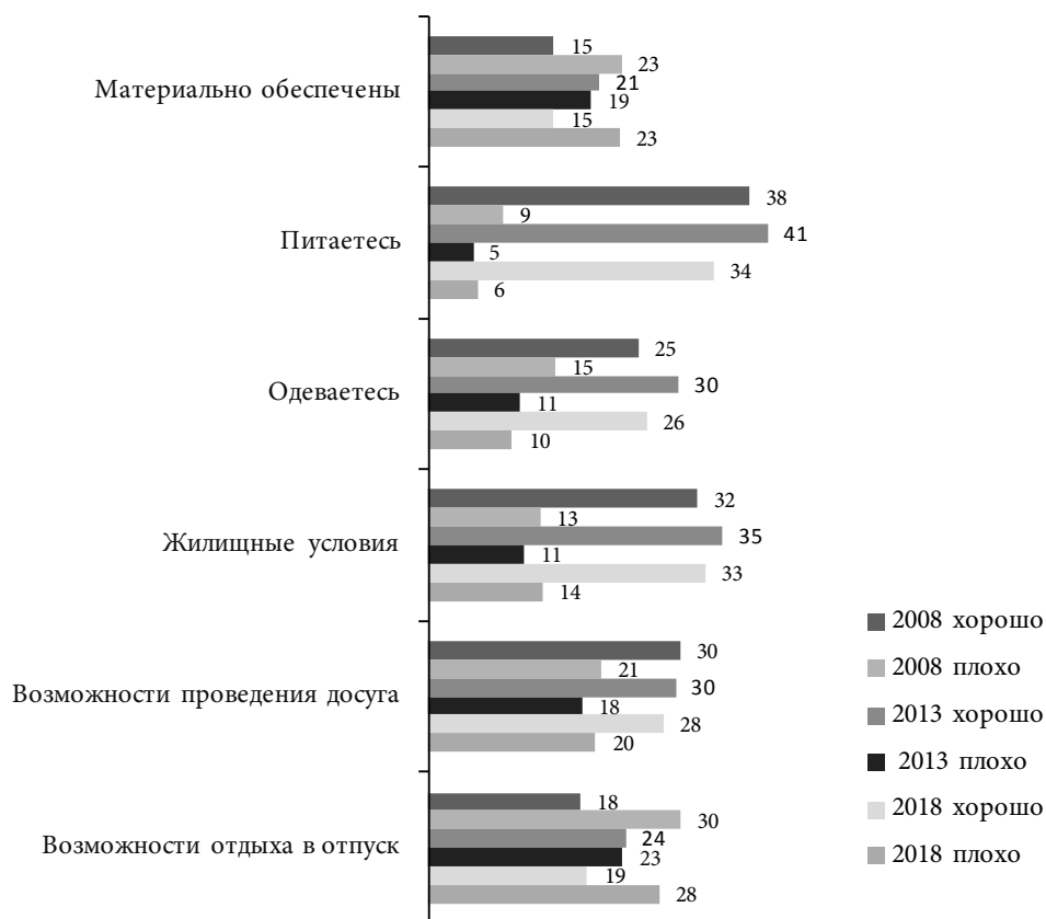
Рис. 2. Динамика хороших и плохих оценок россиянами различных аспектов своего социально-экономического положения, 2008, 2013, 2018 гг., %

Рассмотрим для обоснования этого вывода прежде всего такой объективный показатель материального положения населения, как доходы и их динамика . Как свидетельствуют данные, в последнее время идёт медленный рост номинальных среднедушевых ежемесячных доходов домохозяйств. Так, с октября 2017 г. по апрель 2018 г. они выросли с 17 642 до 18 083 руб., т. е. на 2,5% (или примерно на 5% в годовом выражении). В то же время, если учесть инфляцию, можно говорить скорее об их стагнации в среднем по массовым слоям населения после периода их падения в кризис 2014–2016 гг., но не об их росте. Эта стагнация особенно хорошо видна на показателе медианных среднедушевых ежемесячных доходов, составлявшем весной 2018 г., по данным Мониторинга ФНИСЦ РАН, 15 000 руб., как и в 2015, 2016 или 2017 гг. При этом среднеарифметические доходы, в отличие от медианных, как уже отмечалось выше, за то же время выросли. Такое расхождение между динамикой средних и медианных доходов говорит о неравномерно-