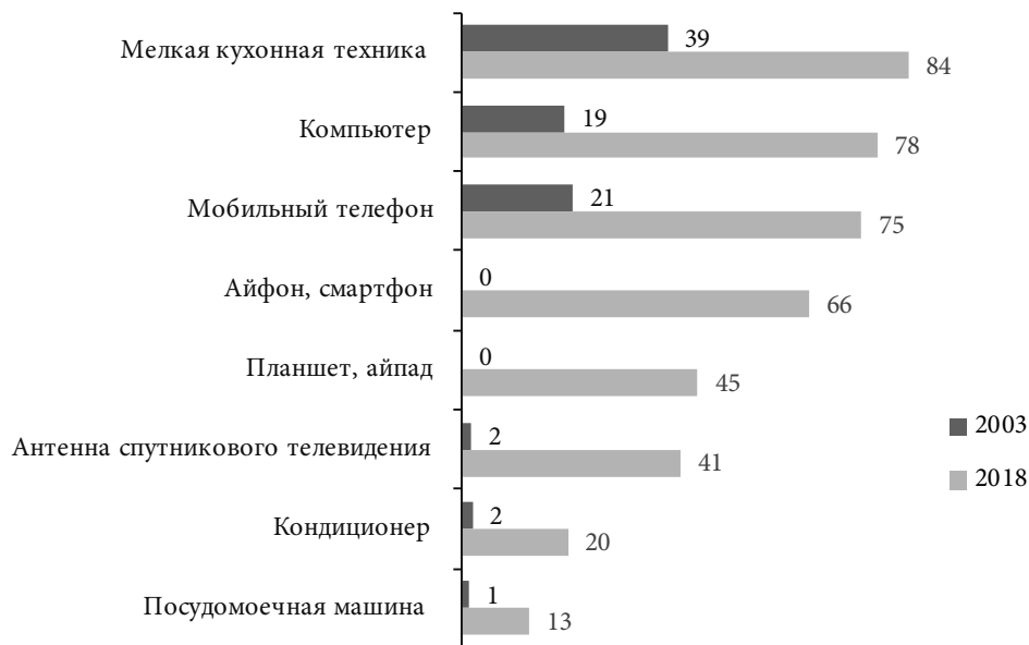
Рис. 5. Динамика численности россиян, имеющих в собственности некоторые виды ТДП, 2003, 2018 гг., %

распространённость всех видов компьютерной техники – компьютеры (в том числе ноутбуки), айпады и планшеты стали новой нормой жизни населения страны во всех слоях, включая низкодоходные. При этом мобильные телефоны, которые пятнадцать лет назад были ещё редкостью, не просто стали нормой жизни россиян, но и дополняются или активно заменяются сейчас айфонами и смартфонами (см. рис. 5). Это отражает то, что россияне всё шире интегрируются в цифровую среду. Об этом свидетельствует и тот факт, что три четверти граждан страны умеют работать на компьютере, причём даже в возрастной когорте 51–60 лет таких уже две трети. Более того, как уже отмечалось в литературе [Столицы..., 2018: 67–91], в Москве и Санкт-Петербурге в 2017 г. использовали цифровые технологии более половины даже тех их жителей, кто был старше 60 лет, и тенденция цифровизации старших поколений достаточно заметно проявлялась и в других регионах. Кроме того, повседневный быт многих россиян стал намного комфортнее за счёт распространения разного рода кухонной техники, спутникового телевидения, кондиционеров, посудомоечных машин и т. д.