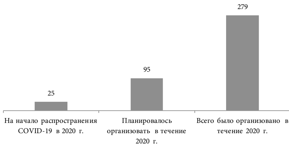
Рис. 2. Коечный фонд в России во время эпидемии COVID-19, 2020 г.,