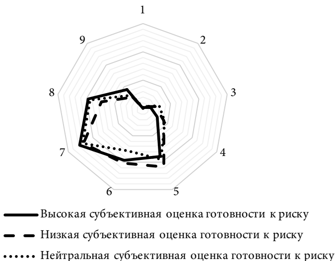
Рис. 4. Субъективная оценка готовности к риску и профиль «престижа», % от количества ответивших в каждой целевой группе

Сравнение конфигураций властных профилей целевых групп указывает на взаимосвязь высокой субъективной оценки готовности к риску с высокими оценками по шкале «власти–бесправности», низкой и нейтральной – с низкими оценками.