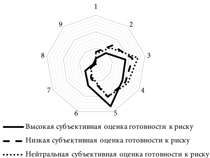
Рис. 3. Субъективная оценка готовности к риску и властный профиль, % от количества ответивших в каждой целевой группе

Результаты анализа указывают на смещение профиля экономического положения в сторону средних и высоких ступеней в группе с высокой субъективной оценкой готовности к риску. Профили низкой и нейтральной оценок практически не различаются и направлены в сторону низких оценок экономического положения.