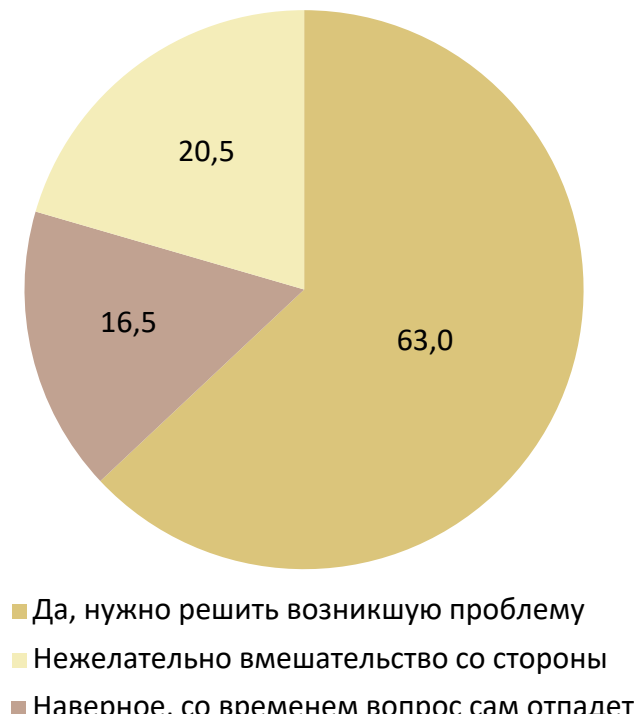
Рис. 2. Причины, по которым к медиаторам не обращаются, %

Хотя судебные разбирательства тяжки и длятся долго, но они считаются более надёжными [17, с. 517]. И это связано с недостаточным пониманием процедуры, что подтверждают ответы 42,1% опрошенных, и уж тем более, с отсутствием осведомлённости о том, что нотариальное удостоверение медиативного соглашения имеет силу исполнительного документа, т. е. определяет, что конкретно должен исполнить каждый из оппонентов.