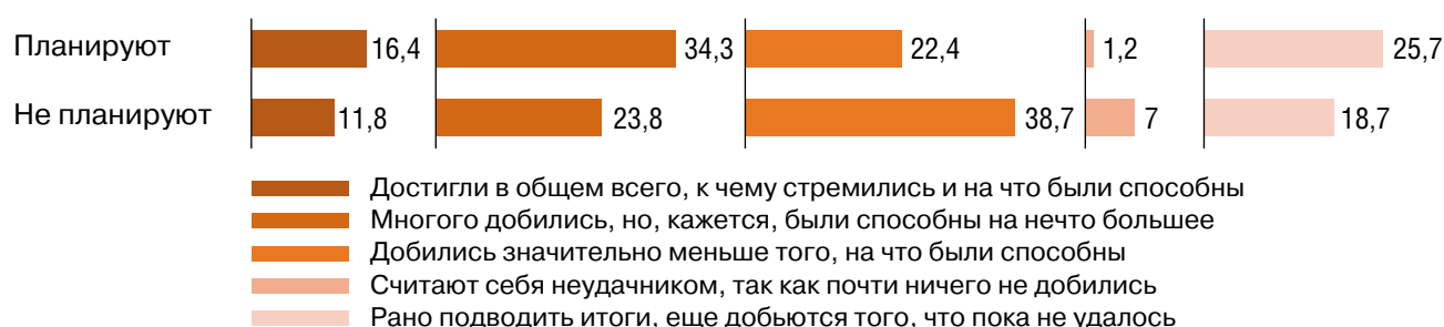
Рис. 2. Оценка реализации жизненных планов в целом в зависимости от наличия/отсутствия горизонта планирования, 2023, %

Дополнительно была проведена проверка устойчивости тенденции оценки своего текущего положения в зависимости от наличия или отсутствия горизонта планирования по параметру реализации планов в целом. На рисунке 2 показано, что большинство респондентов оценивают степень реализации жизненных планов как среднюю. При этом среди тех, кто планирует своё будущее, доля достигших или много добившихся выше, чем среди тех, кто не строит планов вовсе. Также среди планирующих больше тех, кто считает, что способен на большее.